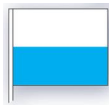
Sinivalkoinen Radan avauskierros kilpailun lähtömerkki