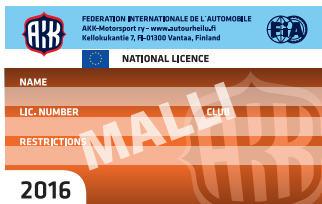
National-lisäkortti kansallisen lisenssin haltijalle.